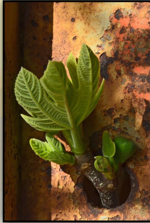
2 ème lot