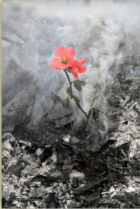
1 er lot