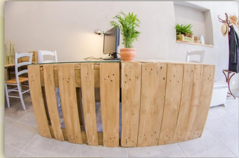
3 ème lot