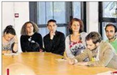
Le comité de bassin d'emploi du Sud Luberon aide les chefs d'entreprise à renforcer leur compétitivité.

Afin de renforcer la compétitivité des entreprises du territoire, le Comité de bassin d'emploi du Sud Luberon (CBE) proposait jeudi dernier dans les locaux de Cotelub une soirée de réflexion "Les Entrepreneurs", réservée aux entrepreneurs. L'objectif de cette soirée était de permettre aux entreprises de connaître le potentiel du territoire et d'imaginer des solutions avec les partenaires locaux, en montant des projets innovants. Une quarantaine de responsables économiques étaient présents à cette seconde soirée de réflexion autour de